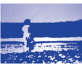
- ASK JONAS - MEMORANDUM de Mounir Fatmi - H(I)J de Guillaume Cailleau